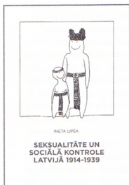
Ineta Lipša. Seksualitāte un sociālā kontrole Latvijā, 1914–1939. Rīga: Zinātne, 2014.

Vēsturnieces Inetas Lipšas monogrāfija ir vairāku gadu darba rezultāts. Pēc apjomīgām latviešu periodikas materiālu studijām pētnieces rīcībā ir plašs 20. gadsimta 20.–30. gadu tekstu korpus, kurā daiļrunīgi spoguļojas tēmas, kuras uztraukušas latviešu sabiedrību sakarā ar dzimuma, dzimtes un seksualitātes problemātiku. Šo korpusu papildina arhīvu un muzeju materiāli, likumi un normatīvie akti, Saeimas runu stenogrammu citāti un atmiņas, dienasgrāmatas un daīlliteratūra.